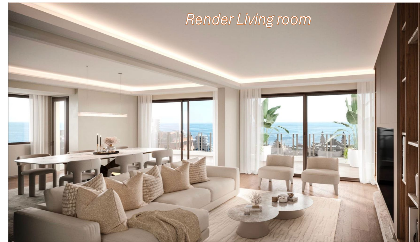
Render Living room